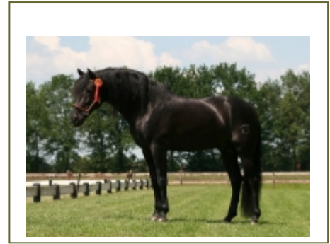
Burgues, 6 jaar oude PRE hengst

Een paard dat voor een TRC aangeboden wordt moet vanzelfsprekend al het Certificaat « Aptitud Basica a la Reproduccion » behaald hebben.